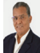
Par Abderrazak Hamzaoui

Alors une autre question s'impose, plus exigeante, plus essentielle. Au-delà de l'amélioration, au-delà de l'optimisation, un déplacement s'opère vers quoi, au fond, avançons-nous ? Car derrière chaque progrès, chaque résultat, chaque succès se joue une direction. Et c'est peut-être là que tout commence.