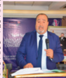
Driss Lachguar Premier secrétaire de l'USFP

Depuis 2021, ce forum s'attache à transformer l'esprit militant commun en force de proposition, de plaidoyer et d'influence législative concrète, traduisant la conviction fondamentale que la rue et l'hémicycle ne sont pas des espaces séparés, mais la continuité d'un même combat pour le changement.