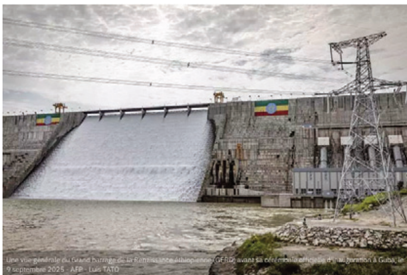
Une vue générale du Grand barrage de la Renaissance éthiopien (GERD), avant sa cérémonie officielle d'inauguration à Gaba, le 9 septembre 2025

Inauguré le 9 septembre, ce plus grand barrage d'Afrique, long de 1,8 kilomètre et haut de