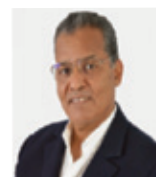
Par Abderrazak Hamzaoui

Le storytelling ne sert pas à faire accepter le changement. Il sert à faire appartenir.