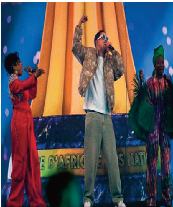
Coupe d'Afrique des nations.

Toujours au Cameroun, le Zangalewa s'impose comme une danse collective, souvent exécutée lors des succès par la sélection locale en