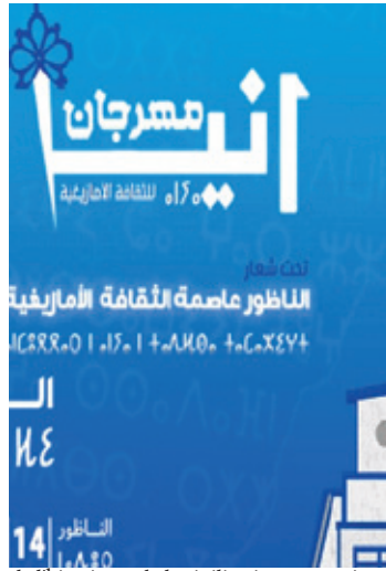
de l'histoire et de la civilisation marocaines.

Organisée autour du thème "Nador, capitale de la culture amazighe", cette édition vise, selon la même source, à poursuivre la valorisation de la culture amazighe en tant que capital civilisationnel commun à tous les Marocains et à mettre en avant sa profondeur historique et humaine, tout en la concrétisant de manière symbolique et pratique, avec tout ce qu'elle recèle de patrimoine culturel reflétant les divers aspects