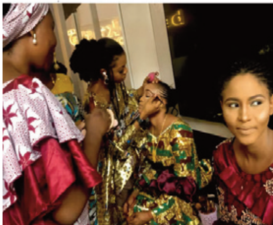
quelque 200 films par mois.

Un jour de tournage ordinaire à Kannywood, qui produit