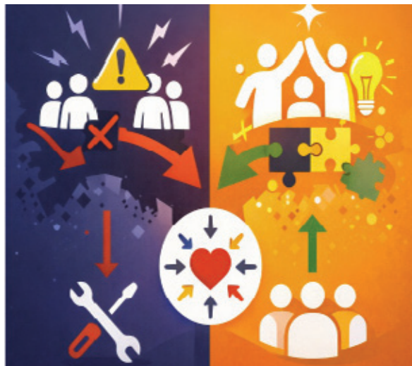
Le changement est d'abord une expérience humaine.

C'est à cet endroit précis que le storytelling révèle toute sa puissance. Non comme un outil de persuasion, encore moins de manipulation, mais comme un espace de reconnaissance. Le récit donne à chacun la possibilité de se sentir partie prenante d'une histoire collective. Il offre un cadre dans lequel le changement n'est plus une injonction extérieure, mais un chapitre à écrire ensemble. Dans l'histoire ainsi partagée, chacun trouve sa place, son rôle, sa contribution. Le changement cesse d'être une menace à subir pour devenir un récit à incarner. Le véritable enjeu du changement n'est donc pas la résistance. Il est l'appartenance.