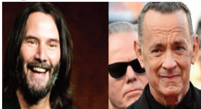
téraire de janvier.

Ces deux ouvrages font partie des nombreux romans anglo-saxons publiés en français à l'occasion de la rentrée lit-