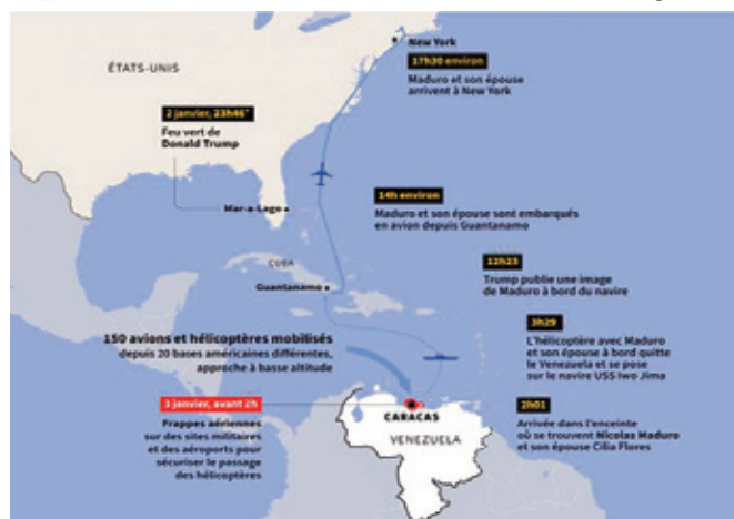
Manifestation à moto

Ils sont notamment accusés de s'être alliés avec la guérilla des Forces armées révolutionnaires de Colombie (FARC), que Washington considère comme "terroriste", ainsi qu'à des cartels criminels pour "acheminer des tonnes de cocaïne vers les Etats-Unis".