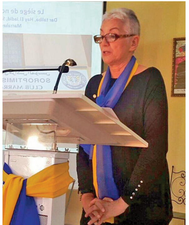
Fondatrice du Club de Marrakech de l'Association internationale Soroptimist

Notre devise étant qu'il n'y a pas de petite donation. Chaque geste, chaque regard, chaque visite de l'internat ont permis à nos jeunes filles une ouverture sur le monde et la promesse d'un avenir jusque-là inespéré».