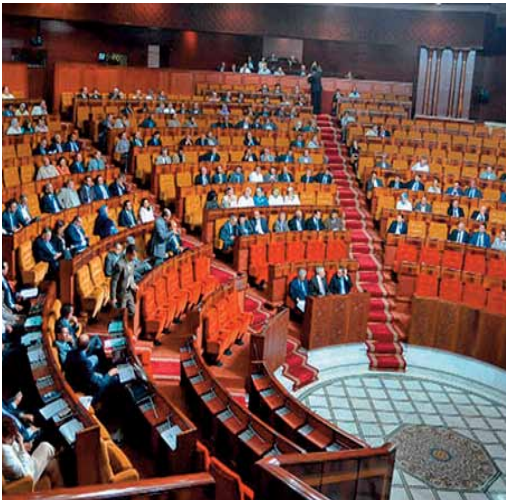
L'absentéisme des ministres n'honore en rien le gouvernement.