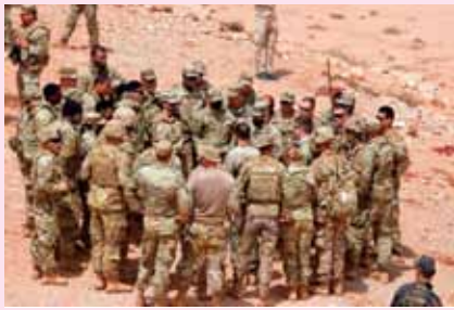
Sur Hautes Instructions de Sa Majesté le Roi, Chef Suprême et Chef d'Etat-Major Général des Forces Armées Royales (FAR), l'Etat-Major de la Zone Sud