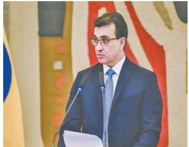
Carlos Alberto Franco França

Lors d'un échange, lundi, entre Nasser Bourita, ministre des Affaires étrangères, de la Coopération africaine et des Marocains résidant à l'étranger et son homologue brésilien Carlos Alberto Franco França, Rabat et Brasilia ont réitéré leur volonté farouche de poursuivre la dynamique de coopération bilatérale dans le but de poser les jalons d'un véritable partenariat stratégique multidimensionnel basé sur le dialogue politique et la coopération économique.